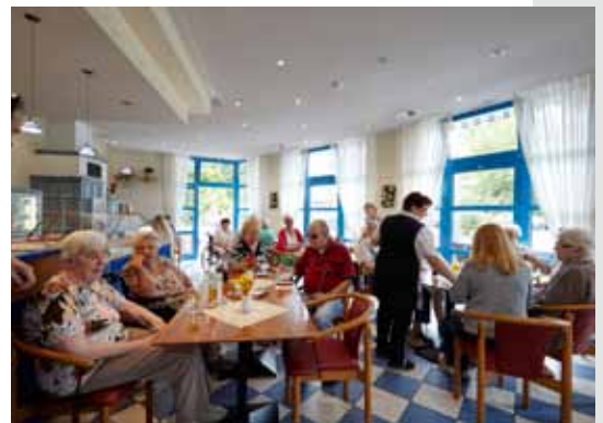
Café am Park

Plaidt bietet als Grundzentrum eine ausgeprägte Infrastruktur mit Arztpraxen, Apotheken, Postfiliale, Banken und guten Einkaufsmöglichkeiten. Der Ort ist Knotenpunkt verschiedener Buslinien, hat einen Bahnhof sowie eine eigene Autobahnzufahrt und ist damit sehr gut zu erreichen.