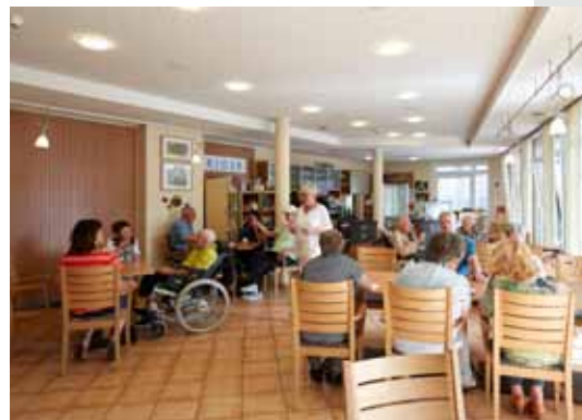
Café am Obertor

Gastronomie, Ärzte, Apotheke, Postfiliale, Banken und Einkaufsmöglichkeiten sind in der Stadt vorhanden. Busverbindungen bestehen nach Polch, Mayen und an die Untermosel.